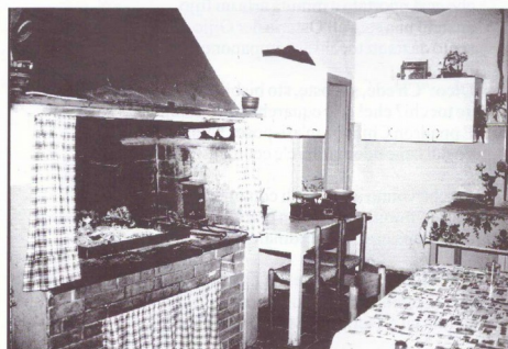
...e la sua cucina