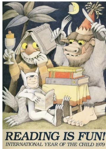
Sopra Maurice Sendak: poster